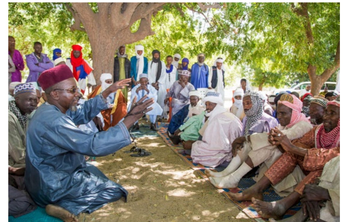
Réunion entre agriculteurs et éleveurs portant sur les couloirs de passage du cheptel, en présence du chef du groupement Peuhl du village de Toga et du préfet de Guidan Roumdji.

La Suisse a joué un rôle prépondérant dans la définition d'une politique de financement et de conseil agricoles , ainsi que d'une politique foncière nationale . La refonte des lois sur la législation foncière et les schémas d'aménagement fonciers élaborés dans deux régions, ont permis de réduire sensiblement les conflits entre éleveurs et agriculteurs: aucun conflit n'a été enregistré dans les zones d'intervention en 2018, notamment grâce à la restauration de 2'200 ha de pâturage, à la sécurisation de 2'356 km de couloirs de transhumance et à l'établissement de commissions de règlement des conflits efficaces. Ces schémas d'aménagements – qui clarifient les règles de gestion des ressources naturelles – servent désormais d'exemple pour d'autres pays africains. Quelques 190'000 producteurs ont accédé aux intrants et 175'000 exploitations familiales (environ 1 million de personnes) ont bénéficié d'informations, de conseils et de formations fournis par des orga-