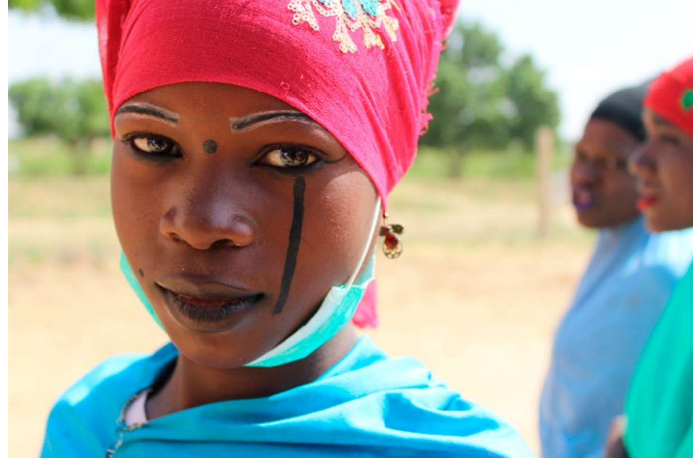
Jeune fille nigérienne - Sites intégrés de formation agricole (SIFA).

Les groupes cibles sont les exclus du système d'éducation, en particulier les non-scolarisés ou déscolarisés, ainsi que les déplacés, réfugiés et migrants qui ne bénéficient souvent pas d'un accès à une éducation ou formation professionnelle de qualité. Les appuis visant à améliorer la qualité de l'éducation de base bénéficieront à quasiment tous les enfants nigériens.