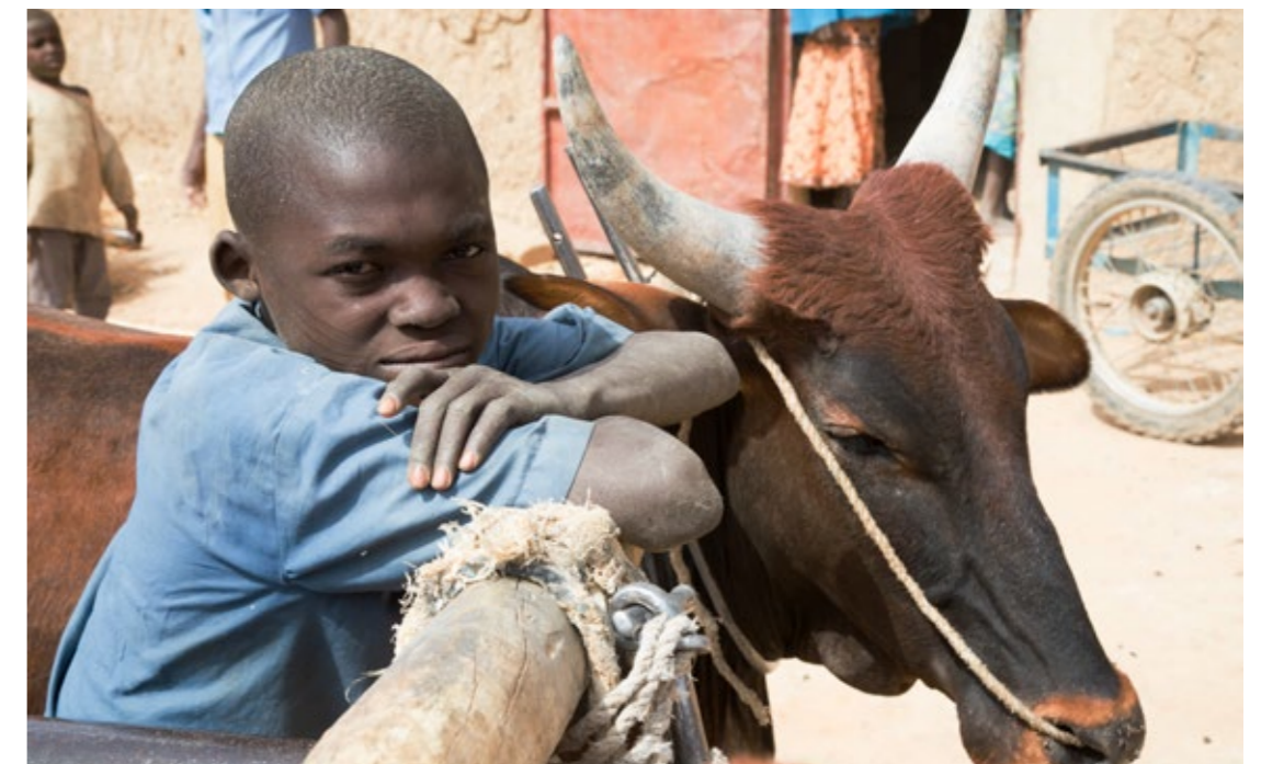
Portrait d'un enfant au niveau du village de Dargué.