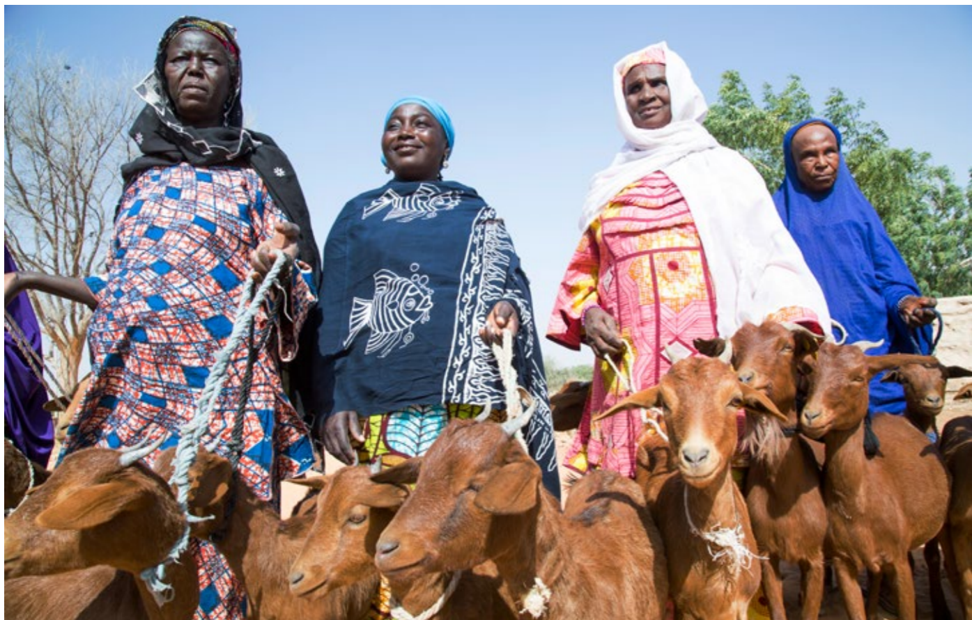
Les nouvelles bénéficiaires des chèvres des groupements féminins de Danza entrant dans le cadre de l'opération embouche bovine initiée grâce à un financement de la coopération suisse.

nisations paysannes partenaires, augmentant leurs rendements de 14% en moyenne. Les organisations paysannes faitières ont aussi été soutenues par les programmes régionaux dans le domaine de la formation, de la fourniture de services et du plaidoyer auprès de la Communauté Economique des Etats de l'Afrique de l'Ouest (CEDEAO), ce qui leur a permis d'augmenter leur capacité d'influence. L'appui régional a aussi soutenu le développement des filières pastorales et des marchés sous régionaux. Bien que le chemin vers la réduction des inégalités entre sexes soit encore long, la position des femmes en termes économiques et de participation a été renforcée . Les appuis suisses ont contribué à améliorer la situation alimentaire et nutritionnelle d'environ 1.7 millions de personnes par année (via des transferts monétaires, reconstitutions de cheptel, cash for work ), tout en renforçant le mécanisme national pour la gestion des crises et des catastrophes.