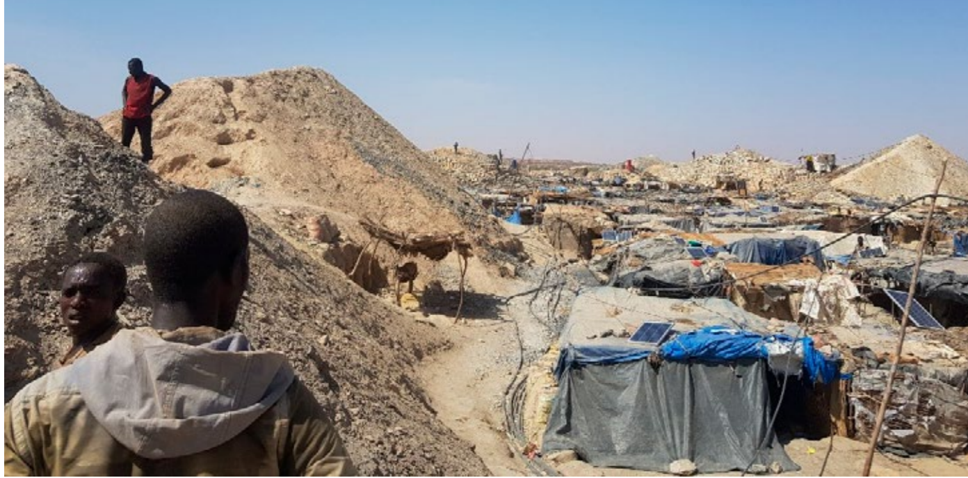
Site d'orpaillage de Komabangou.