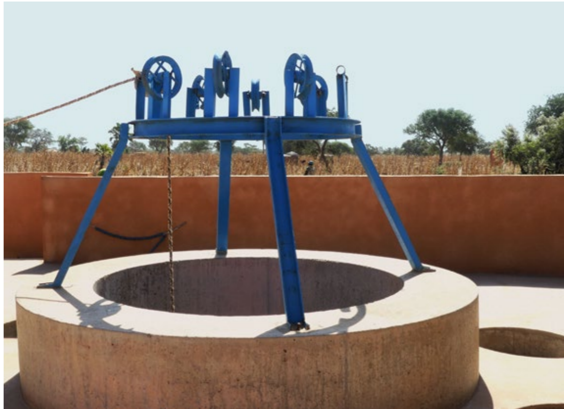
Un puits pastoral- projet PHRASEA.