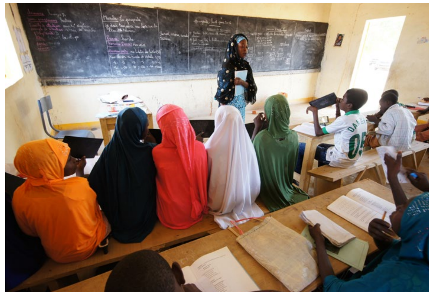
Elèves dans une classe dans un Centre Communautaire d'Education Alternative des Jeunes (CCEAJ).

Les réalisations financières 2016 - 2019 sont au-delà de ce qui était prévu dans la stratégie de coopération. Sur un budget global de CHF 81.5 millions planifiés pour la mise en œuvre de la stratégie par la CS et la DSH, ce sont au final CHF 82.1 millions qui ont été réalisés, sans compter CHF 20 millions de l'aide humanitaire (6.5 bilatéral et 13.5 multi-bi) qui n'étaient pas inclus dans la planification initiale. Ce résultat probant a été atteint même en considérant que la DSH n'a pas concrétisé la majorité des engagements annoncés. La répartition des dépenses par domaine prioritaire (entre 26 et 31% pour chaque domaine) est conforme à la planification (qui visait entre 28 et 33%).