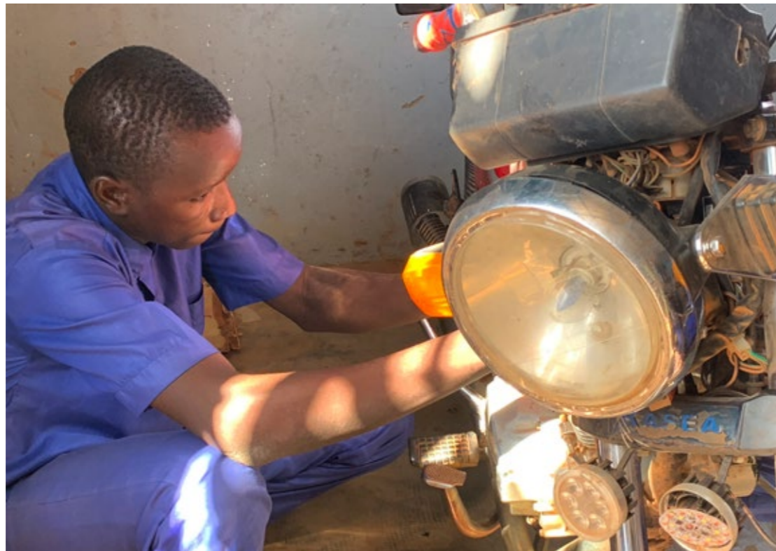
Centre de formation aux métiers (CFM).

Ces orientations coïncident aussi avec la plus-value de l'intervention suisse qui se caractérise par sa flexibilité dans ses mécanismes d'appuis, sa connaissance fine du contexte et la proximité des acteurs locaux, ainsi que par sa capacité d'innovation et d'engagement à long terme. Son intervention a fait ses preuves et est régulièrement saluée par l'Etat du Niger, la société civile et les PTF. Dans un contexte où le volet sécuritaire devient omniprésent, la Suisse se doit de poursuivre son engagement prioritairement axé sur la réduction de la pauvreté en se basant sur sa valeur ajoutée et son expertise et en renforçant la stabilité et la cohésion sociale. Ses champs d'actions correspondent aux défis structurant le développement et la stabilité du pays, et sont des leviers essentiels dans la lutte contre la pauvreté et la prévention de l'extrémisme violent (PEV).