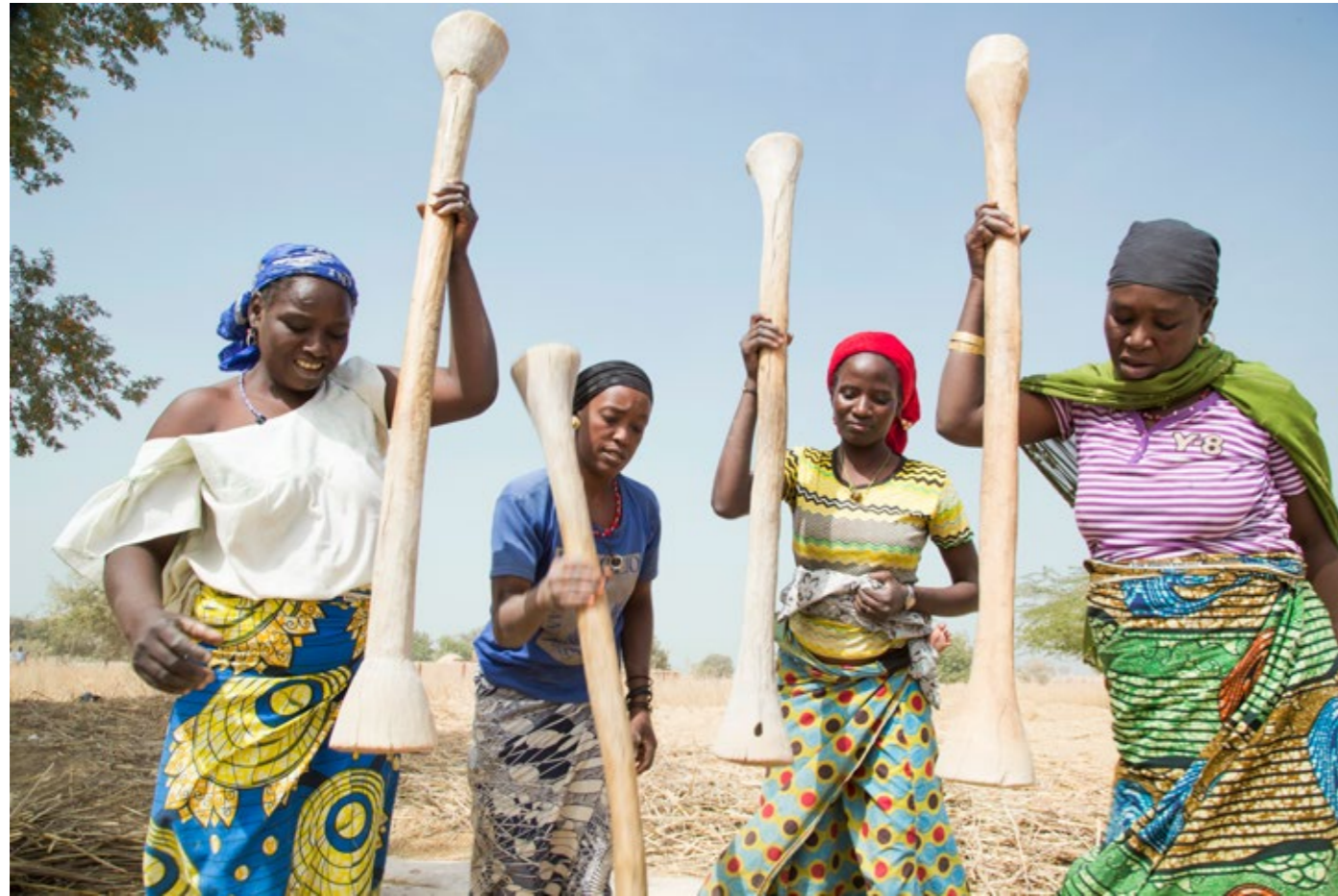
Des femmes en train de battre le mil avant le décorticage dans le village de Dargué.